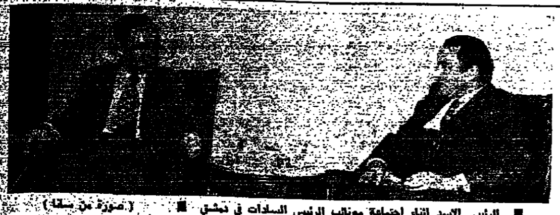
الرئيس الاسد اثناء اجتماعه مع نواب الرئيس السادات في دمشق

اتفاق عرفات - نتمة السيد ياسر عرفات والرئيس الفلسطيني (الى اليمين) اجتماعاً مع الوفد الفلسطيني برئاسة وزير الخارجية فرويمكو في موسكو